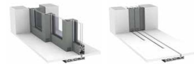
Alzante-scorrevole Pocket solution